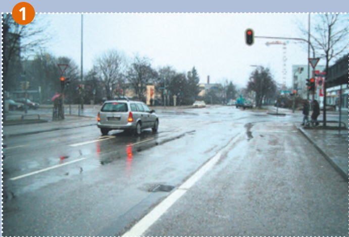
Kreuzung Moosacher Straße/Riesenfeldstraße