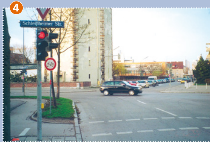
Kreuzung Schleißheimer-/Keferloher Straße