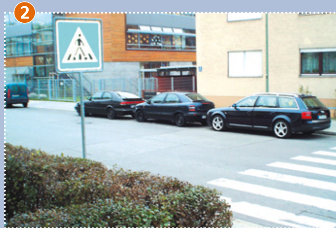
Keferloher Straße – westlich der Schule